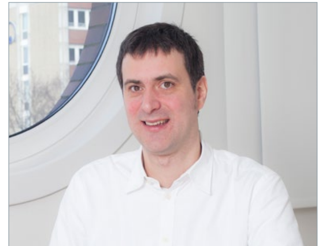
Diesen Artikel hat Jan Deckert verfasst, Leiter Support und Verantwortlicher für die Medisoft-Seminare.

Im Laufe des nächsten Jahres werden wir darüber hinaus auch Seminare über das Internet , sogenannte Webinare , anbieten. Hierbei wird es sich um kurze ein- bis anderthalbstündige Seminare zu einem bestimmten Thema handeln, die wir zeitlich so legen werden, dass Ihnen möglichst wenige Überschneidungen mit Ihren Kernzeiten entstehen.