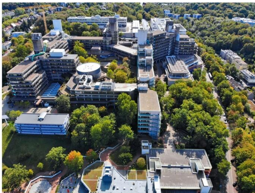
Bergische Universität Wuppertal (BUW)